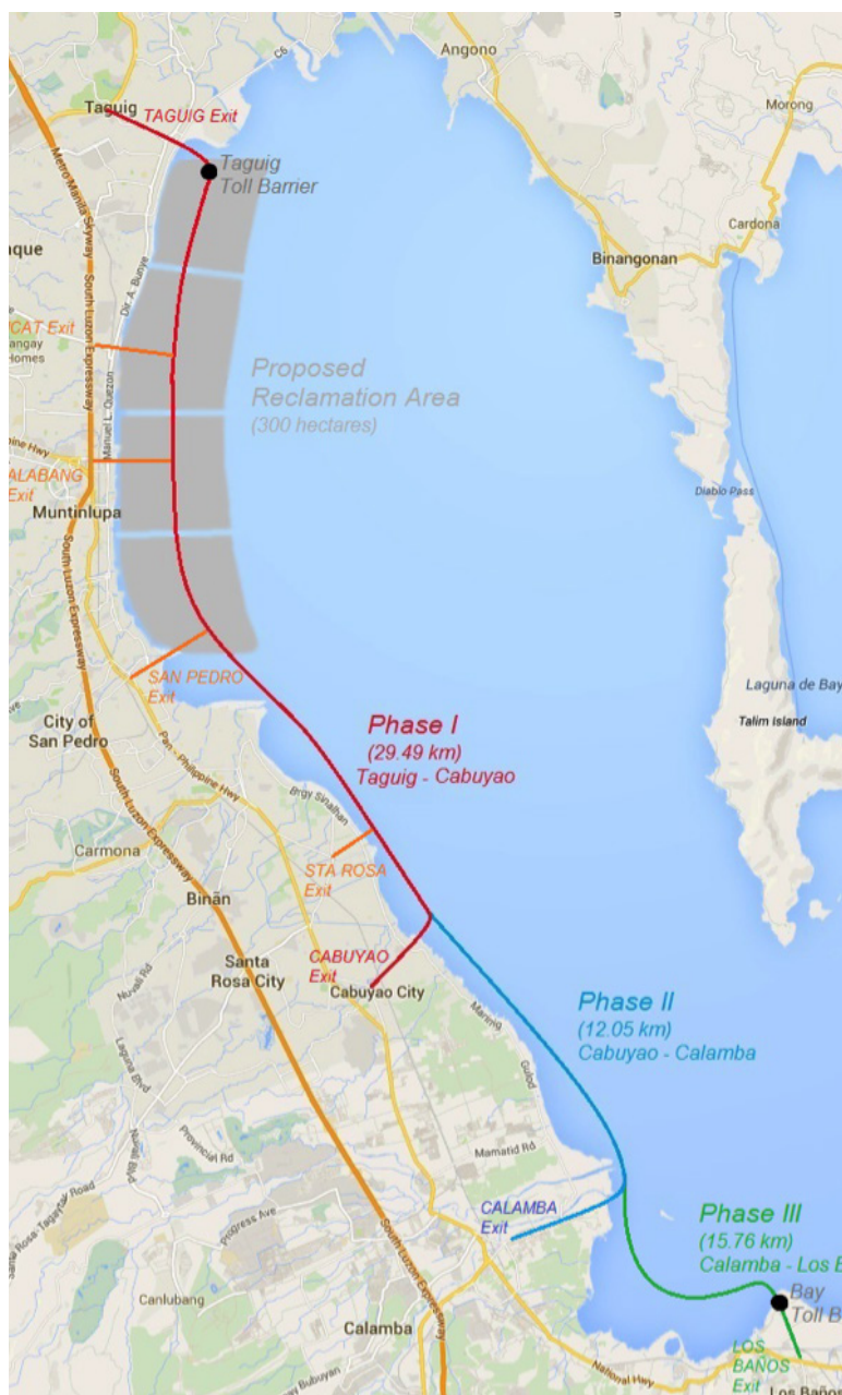
Mapa ng proyektong Laguna Lakeshore Expressway Dike

rehimen ang mga neoliberal na programa, hindi lamang kalupaan, kabundukan at katubigan ng Laguna ang winawasak kundi pati ang kabuhayan at karapatan ng mamamayan na dumaranas ng ibayong kahirapan. Sa probinsya din ng Laguna nagaganap ang malalaking laban ng mga manggagawa, magsasaka, maralitang lungsod at iba pang sektor para sa tunay na kaunlaran. Determinado ang mamamayang Lagunense na ipagtagumpay ang mga pakikibakang ito at muling mabawi ang paraisong inagaw sa kanila upang linangin para sa lahat ng mamamayan. 📍